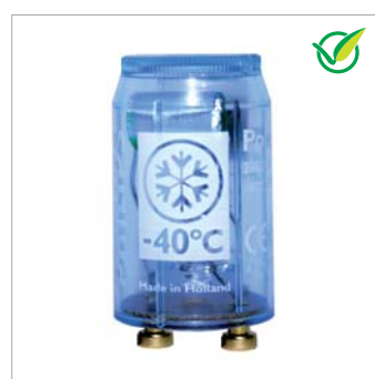
Стартер P10 Polar